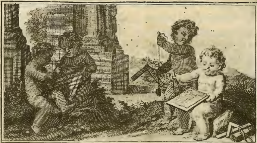
Ant. Gonz. inv.